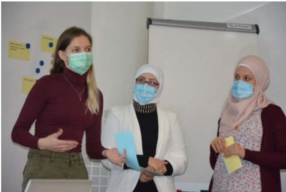
Absolventinnen des Kurses integra abc