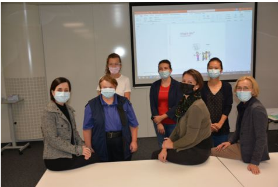
Absolventinnen des Kurses integra abc

Der Schreib-Leseservice wurde 44 Mal in Anspruch genommen (Themen: Arbeitsrecht, Sozialversicherungen, Mietbeihilfe, Prämienverbilligung etc.).