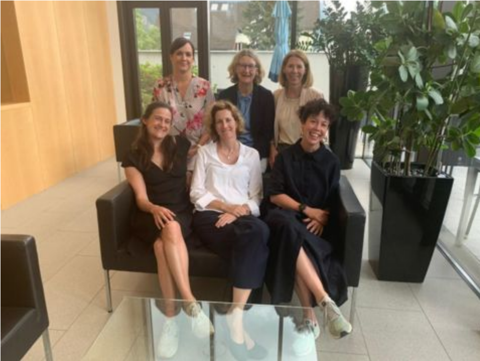
Die Projektgruppe von «Vielfalt in der Politik»