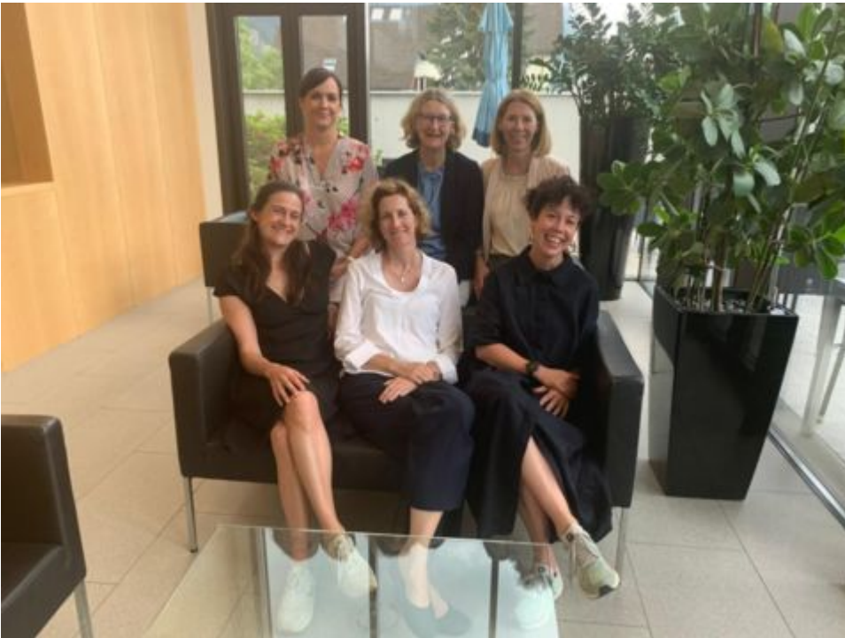
Die Projektgruppe von «Vielfalt in der Politik»