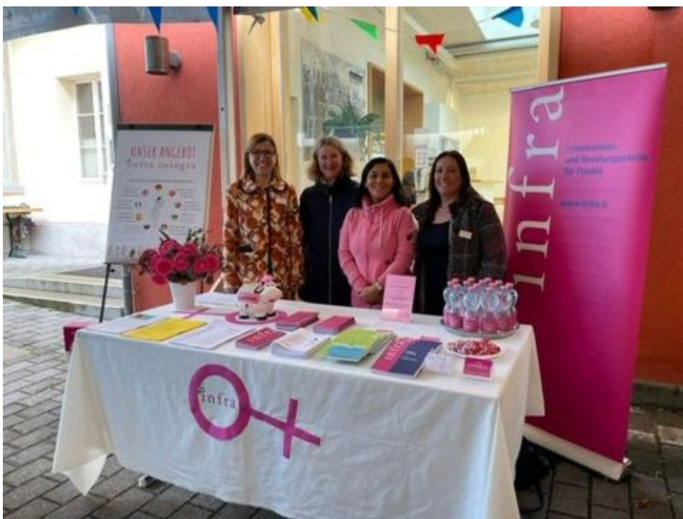
integra am Fest der Kulturen

Am interkulturellen Fest haben wir mit dem ganzen integra-Team mit einem Stand teilgenommen und unser Angebot vorgestellt.