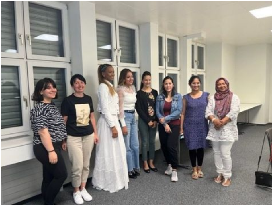
Absolventinnen des Kurses integra abc

In den vergangenen Jahren erhielten wir von Teilnehmerinnen immer wieder die Rückmeldung, dass sie es begrüßen würden, den Kurs integra abc auf vier Abende auszuweiten, um mehr Zeit für die Behandlung der einzelnen Themenbereiche zur Verfügung zu haben. Aus diesem Grund beschlossen wir, die Themen «Bildungssystem und Diplomanerkennung» sowie «Arbeit und Recht» nicht mehr im Rahmen des dreiteiligen Kurses integra abc zu behandeln. Sie werden fortan als für alle Interessierten offene Informationsveranstaltungen separat angeboten. Im Kurs integra abc bleibt somit mehr Zeit für die elementaren Themen der Arbeitssuche. Die Teilnehmerinnen werden dazu aufgefordert, auch die beiden Informationsveranstaltungen zu besuchen. Der Kurs integra abc fand an drei Abenden im September statt. Acht Frauen aus acht Nationen (Mexiko, Aserbaidschan, Bangladesch, Ukraine, Philippinen, Afghanistan, Brasilien und Indien) beschäftigen sich intensiv mit dem Arbeitsmarkt, den notwendigen Bewerbungsunterlagen und dem Vorstellungsgespräch.