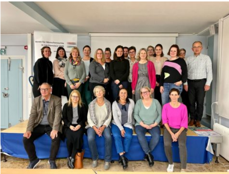
Teilnehmer*innen des Runden Tisches zur bezahlten Elternzeit

Am 15. November fand in der Spörry Fabrik in Triesen der erste «Runde Tisch Gleichstellung» statt, der vom Verein für Menschenrechte mit Unterstützung des Frauennetzes und des Vereins für Männerfragen organisiert wird und dem Informationsaustausch und der politischen Vernetzung dient. Der «Runde Tisch Gleichstellung» thematisierte die bezahlte Elternzeit, die als Folge der EWR-Mitgliedschaft auf der Grundlage der EU-Richtlinie von 2019 zur Vereinbarkeit von Beruf und Privatleben in Liechtenstein eingeführt werden muss. Eigentlich hätte die EU-Richtlinie schon 2022 in Liechtenstein umgesetzt werden sollen, die Regierung verzögerte die Umsetzung jedoch, sodass die Vernehmlassung und der gesetzgebende Prozess erst 2023 stattfinden und vor 2024 nicht mit einem konkreten Gesetz zur bezahlten Elternzeit gerechnet werden kann.