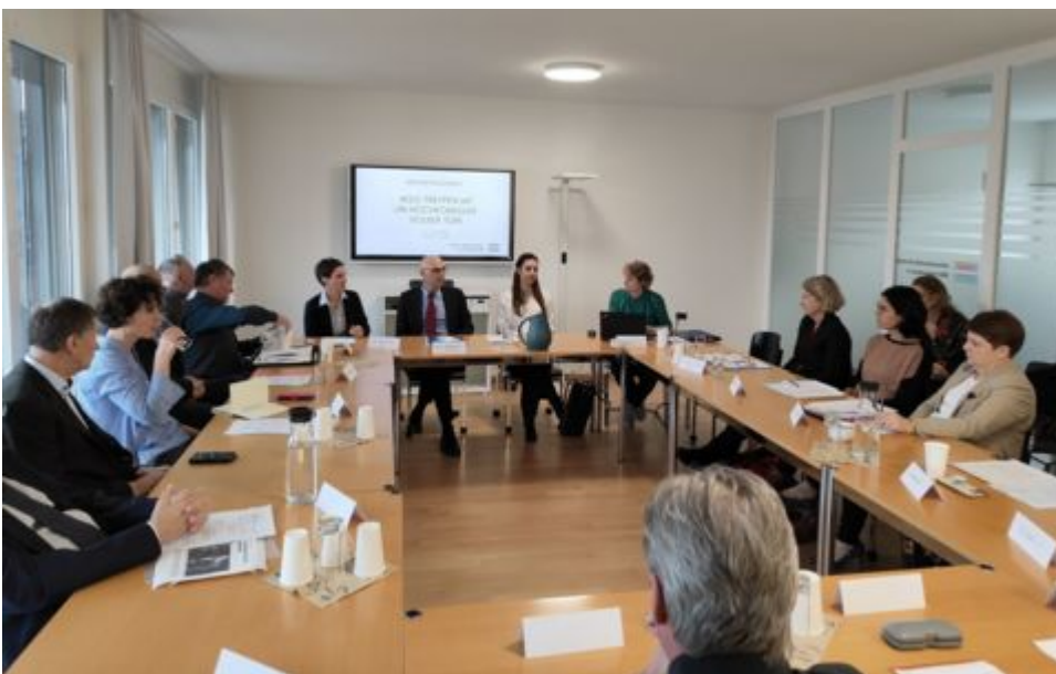
Treffen liechtensteinischer NGOs mit UNO-Hochkommissar Volker Türk